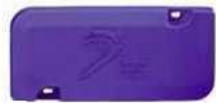
univerzálny stišovač Parrot